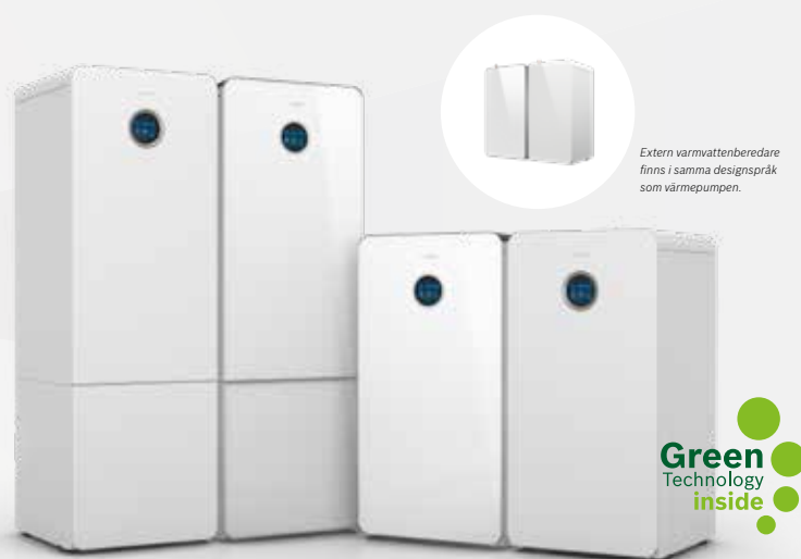
Bosch Compress 7001i LWM

Våra nyutvecklade, rostfria varmvattenberedare ger dig upp till 300 liter 40-gradigt varmvatten. Mer än tillräckligt för att fylla ett badkar och ändå kunna duscha varmt samtidigt. Varmvattenfunktionen styrs enkelt via värmepumpens touchdisplay och kan ställas in på Ekonomi-, Normal- eller Komfortläge, beroende på hur mycket varmvatten du är i behov av.