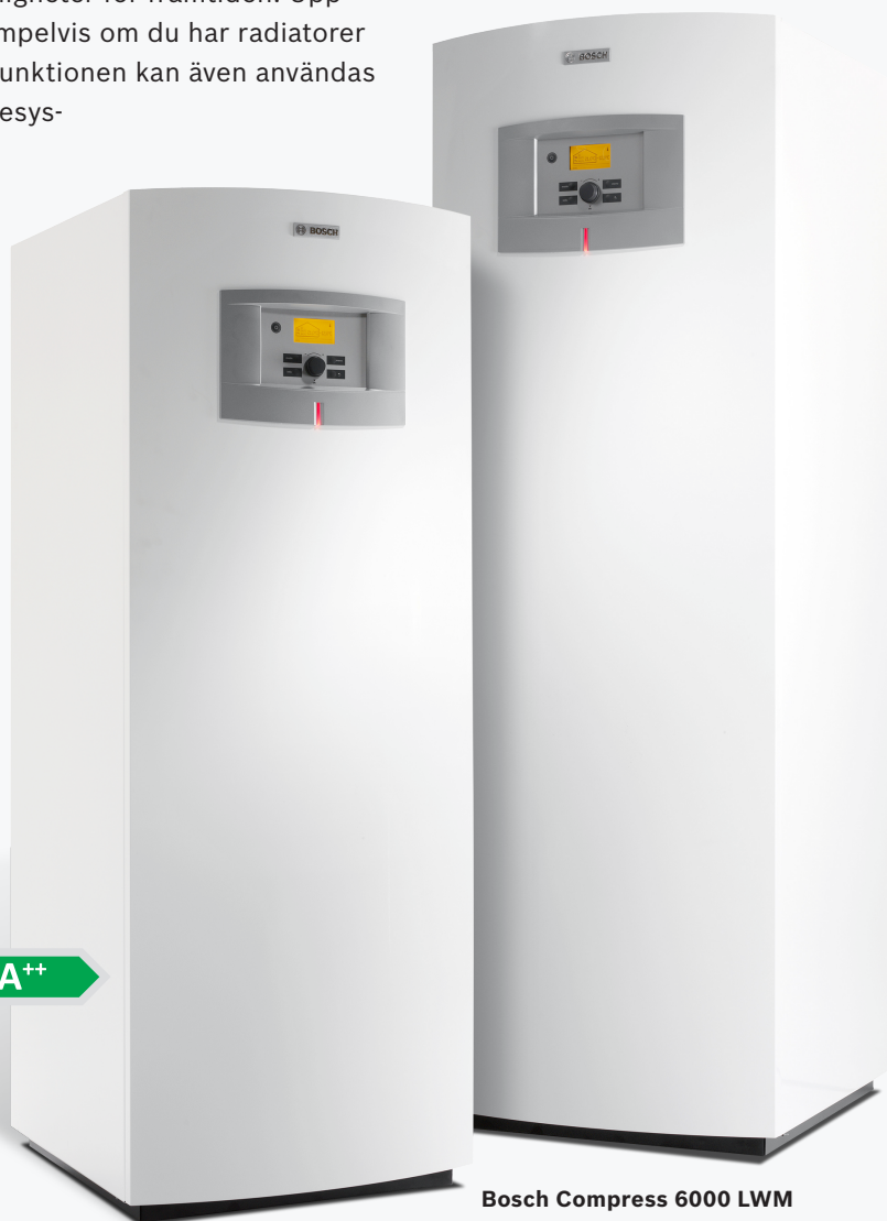
Bosch Compress 6000 LW