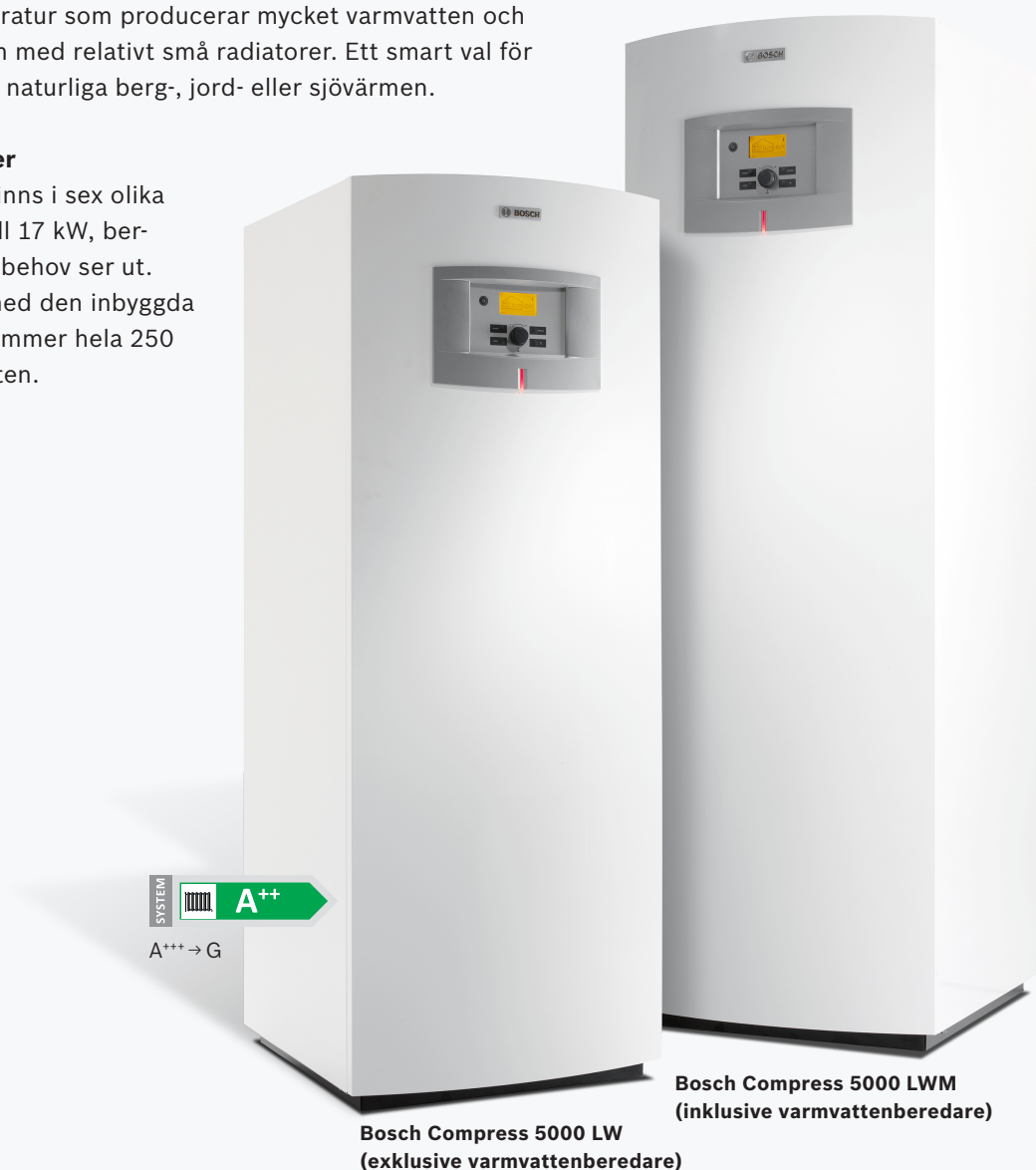
Bosch Compress 5000 LW (exklusive varmvattenberedare)

Compress 5000 LW/M finns i sex olika effektstorlekar, från 6 till 17 kW, beroende på hur ditt värmebehov ser ut. Den rostfria modellen med den inbyggda varmvattenberedaren rymmer hela 250 liter 40-gradigt varmvatten.