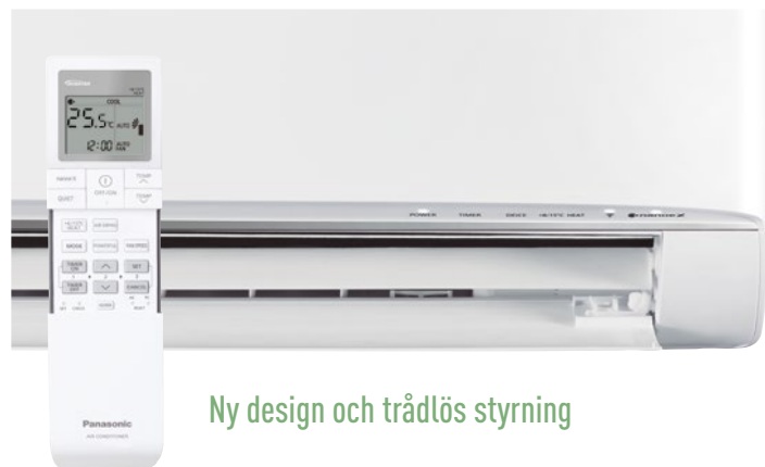
Ny design och trådlös styrning

Det är anledningen till att vi nu presenterar en ny generation av luftkonditioneringsapparater med R32, ett innovativt köldmedium på alla tänkbara sätt: det är lätt att installera, har en mindre miljöpåverkan jämfört med de flesta andra köldmedier och sparar energi. Resultatet? Större välbefinnande för människorna och för planeten. Det kommer alltid att finnas människor som motsätter sig förändring. Men vi säger: Hej då till gårdagen.